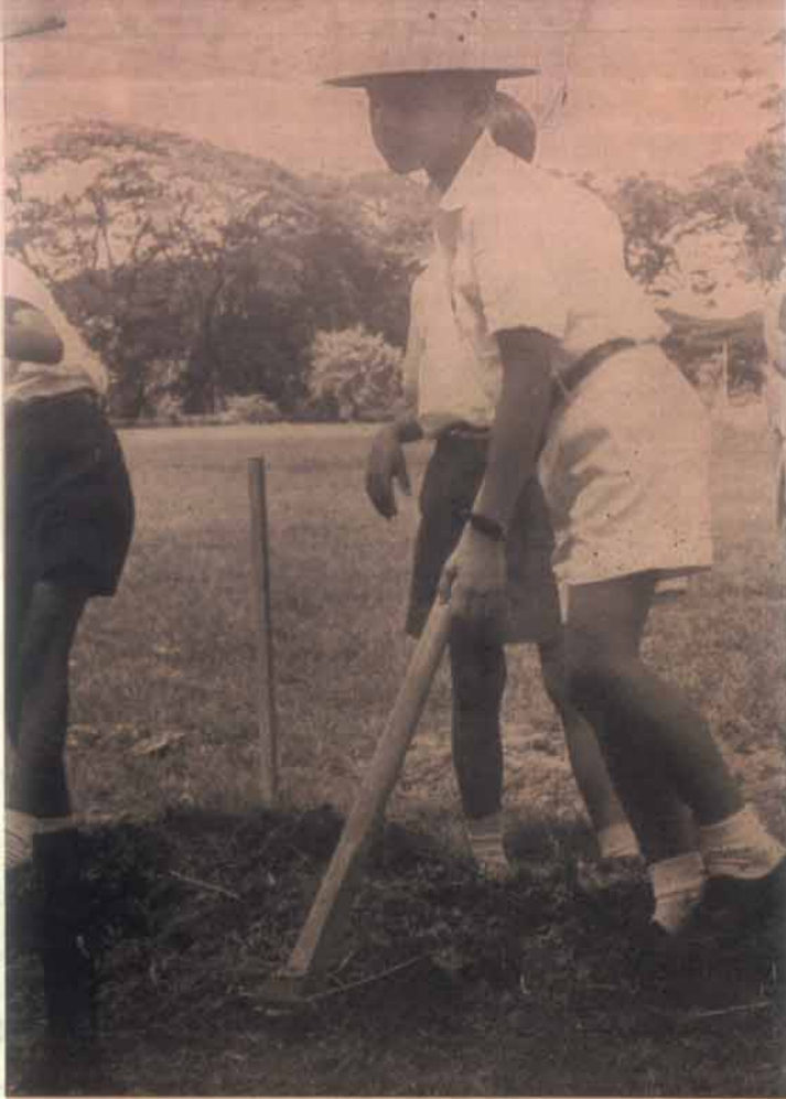
ทรงปลูกผักต่าง ๆ หลังเสด็จโรงเรียน