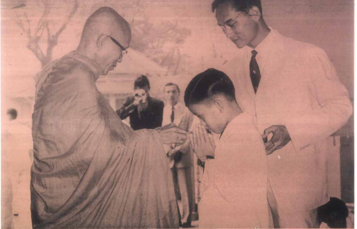
พระบาทสมเด็จพระเจ้าอยู่หัวทรงอบรมพุทฺธกรรมพร้อมพวกราชวงศ์ด้วยพระองค์เองเสมอ

ทุกคนมีฐานะ ทุกคนอยากจะทำอะไรที่เกี่ยวข้องกับการประสูติครั้งนี้ด้วย ราษฎรที่ปรารถนาจะแสดงความจงรักภักดีก็ประชุมกันอยู่ที่หน้าพระลาน พวกที่มีรถยนต์เป็นพาหนะก็แล่นรถเที่ยวไปเที่ยวมาอยู่บริเวณนั้น เพื่อจะฟังข่าว การประสูติให้ใกล้ชิด เพื่อรอฟังเสียงปืนใหญ่ เพื่อดูให้เห็นชัดว่าทหารจะยิงปืน หรือเพียงแต่จะได้ยินเสียงฆานในประโคมดุริยางค์เท่านั้น