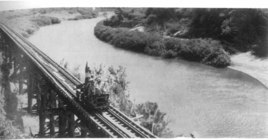
(บน) ทางรถไฟสายมรณะคอนเสียบหน้าผาต้า กระเซ