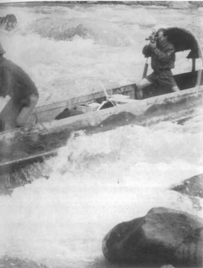
(ล่าง) ทากล้องบันทึกภาพการสำรวจมนุษย์หิน ของคณะสำรวจไทย-ดัทช์