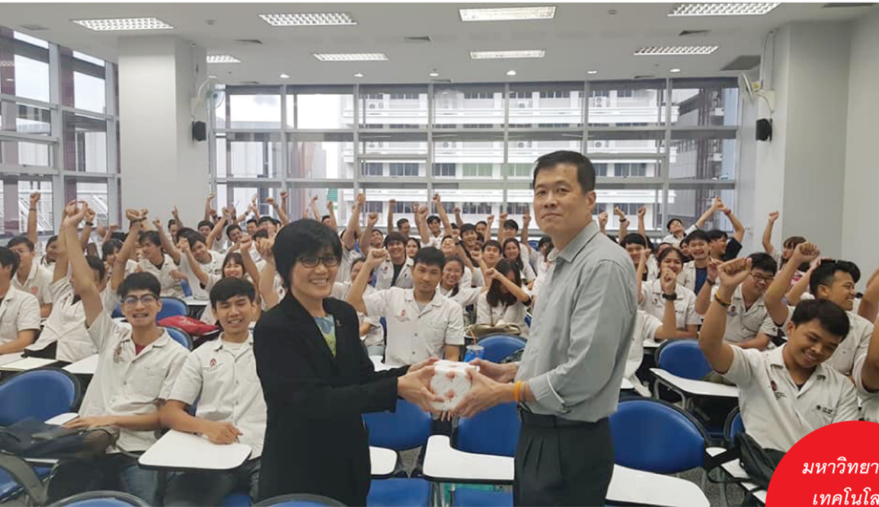
มหาวิทยาลัย เทคโนโลยี พระจอมเกล้า พระนครเหนือ