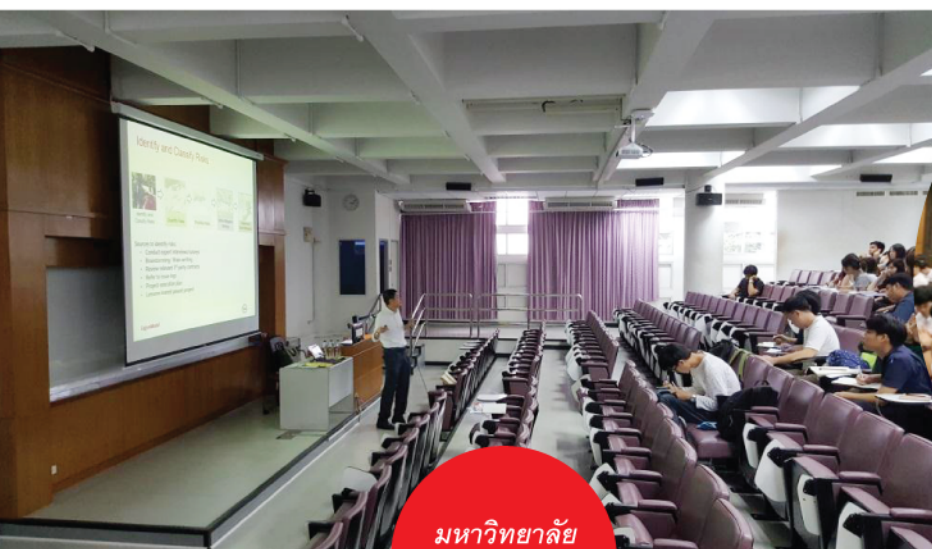
มหาวิทยาลัย ธรรมศาสตร์