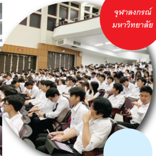
จุฬาลงกรณ์ มหาวิทยาลัย