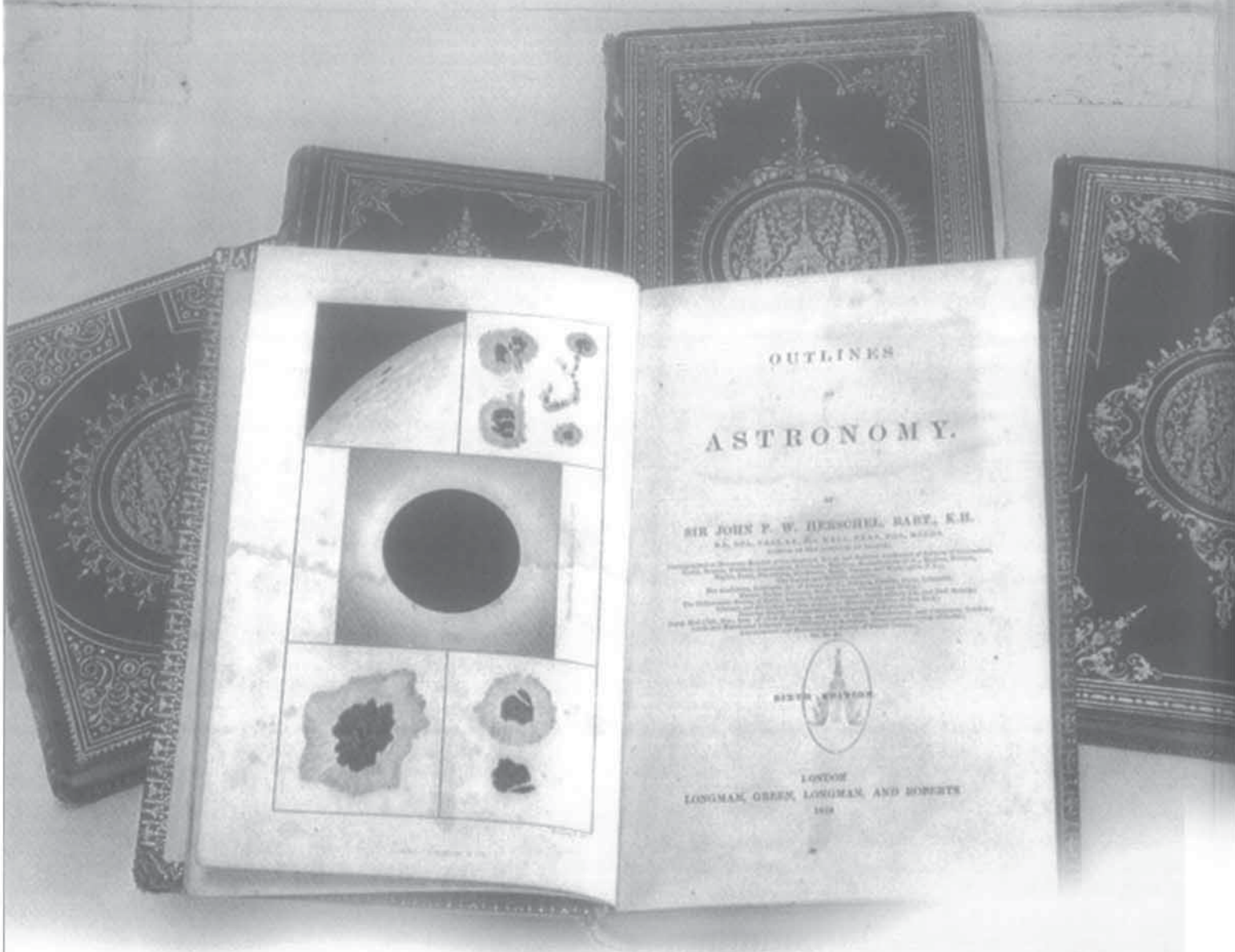
พระบาทสมเด็จพระจอมเกล้าเจ้าอยู่หัว ทรงเป็นผู้นำในการศึกษาศิลปวิทยาการสมัยใหม่ โดยเฉพาะวิชาการด้านดาราศาสตร์ ทรงศึกษาอย่างเชี่ยวชาญ

การสร้างโบสถ์ วิหาร ศาลาการเปรียญ ฯลฯ มีข้อฟ้าใบระกาที่สร้างกันต่อมาในชั้นหลังโดยไม่มีข้อหวงห้าม จึงเป็นพระราชดำริใหม่ที่ทรงพระกรุณาโปรดเกล้าฯ พระราชทานไว้แต่ เมื่อปีฉลู จุลศักราช ๑๒๑๔ (พุทธศักราช ๒๓๙๖)