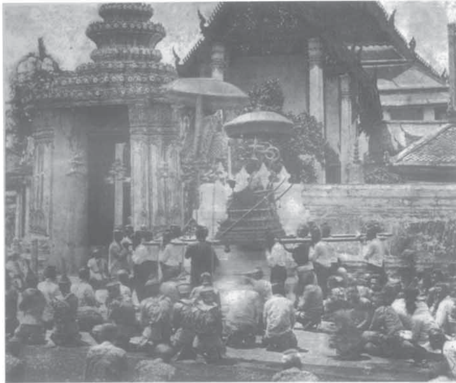
พระบาทสมเด็จพระจอมเกล้าเจ้าอยู่หัว ทรงพระกรุณาให้ราษฎรฟ้าฯ รับเสด็จ ในเส้นทางเสด็จพระราชดำเนิน ได้ทั้งสกลมารคและชลมารค

พระเจ้าปราสาททองปลอมพระองค์เสด็จ ประพาสเกาะบางปะอิน พระเจ้าเสือปลอม พระองค์ไปทรงเที่ยวเล่นชกมวยกับราษฎร ชาวบ้านที่แขวงเมืองวิเศษไชยชาญ ฯลฯ