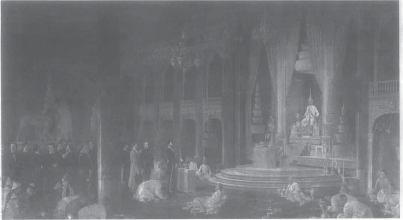
ธรรมเนียมการเข้าเฝ้าของขุนนางไทยและชาวต่างชาติก็แตกต่างกัน ▲