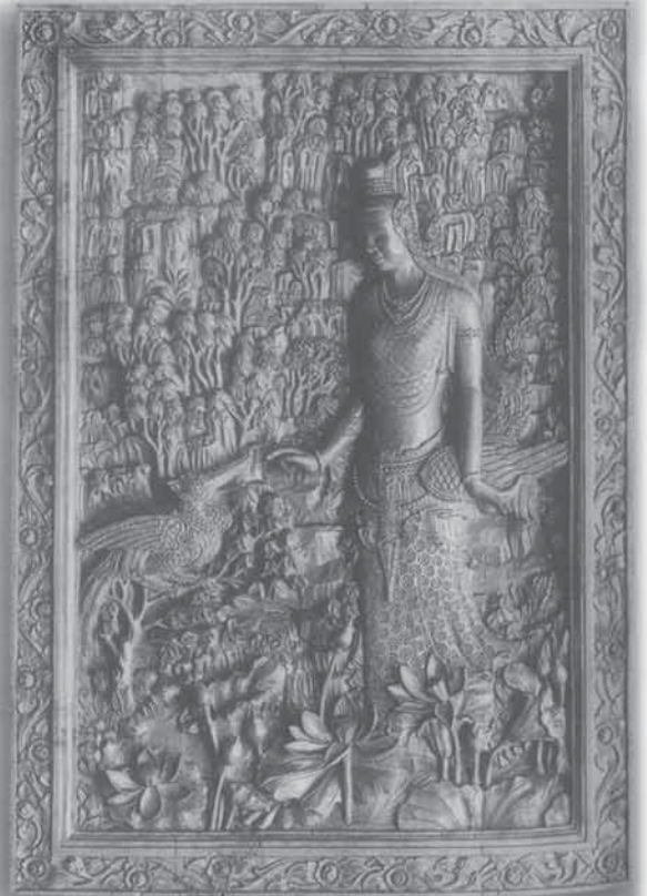
ไม้แกะสลักนาคลายวิจิตร

๑๑. การทอผ้าจก เป็นศิลปะการทอ ผ้าของไทยอีกแบบหนึ่ง มีลวดลายและสี สัน งดงาม เดิมทอใช้เป็นเชือกผ้าชิ้น แต่ปัจจุบัน ได้ดัดแปลงนำมาใช้ตกแต่งส่วนอื่นๆ ของ เสื้อผ้า และสิ่งของเครื่องใช้อื่นๆ