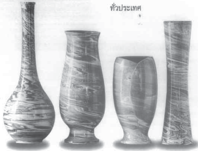
▲ เครื่องปั้นลายดินบ้านนาขาม ▼ การเขียนสีบนโกเชรามิกก่อนการเคลือบ

๑๖. เครื่องเงินและเครื่องทอง กลุ่มชาวไทยภูเขาที่มีฝีมือในการทำเครื่องเงิน ได้กราบบังคมทูลขอพระราชทานความช่วยเหลือในการประกอบอาชีพ สมเด็จพระนางเจ้า พระบรมราชินีนาถ จึงทรงพระกรุณาโปรดเกล้าฯ ให้เข้ามาปฏิบัติงานถวายเป็นครูสอนวิชาเครื่องเงินแก่นักเรียนศิลปาชีพที่ทรงคัดเลือกจากครอบครัวราษฎรยากจนทั่วประเทศ