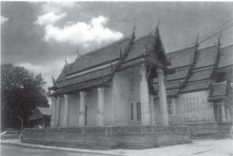
วิหารน้อย ตั้งอยู่ด้านทิศตะวันออกของอุโบสถภายในมีพระพุทธรูปห้อยพระบาท ประดิษฐานเป็นพระประธานของวิหาร

กว้าง ๖๐ เซนติเมตร สูง ๒.๖๐ เมตร หนาประมาณ ๑๒ เซนติเมตร เป็นบานไม้แกะสลักปิดทองด้านบนเป็นลายเทพนม อยู่ในซุ้มบานละ ๓ องค์ ส่วนตรงกลางของบานจำหลักเป็นรูปครุฑ นาค และสัตว์ต่าง ๆ ประกอบลายพรรณพฤกษาได้อย่างกลมกลืน