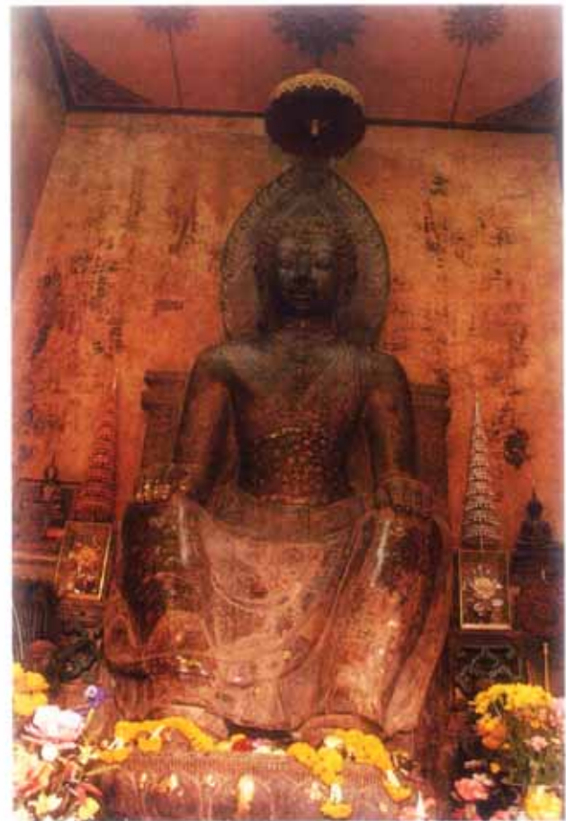
พระพุทธรูปกิลลา พระประธานของวิหารน้อยเป็นงานศิลปกรรมแบบทวารวดี