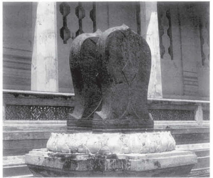
ภาพหน้าซ้ายและภาพบน คือหนึ่งในสถาปัตยกรรมอันงดงามซึ่งรายรอบอยู่บริเวณวัด

มรดกทางวัฒนธรรมของประเทศไทยนั้นมีอยู่อย่างมากมาย มหาศาล แต่เป็นที่น่าเสียดายว่า เยาวชนไทยในปัจจุบันไม่ค่อยให้ ความสนใจอย่างจริงจังเท่าใดนัก แม้จะได้มีการประกาศรณรงค์ปี วัฒนธรรมไทยติดต่อกันมาหลายปีแล้วก็ตาม แต่ก็ดูเหมือนว่าจะไม่ ค่อยได้ผลมากเท่าใดนัก ทั้งนี้เพราะกระแสวัฒนธรรมต่างชาติโดย เฉพาะจากทางชาติตะวันตกได้หลั่งไหลเข้ามาอย่างรวดเร็วและต่อ เนื่อง การที่จะปลูกจิตสำนึกเยาวชนให้เกิดความรักและห่วงใยใน วัฒนธรรมไทยอย่างแท้จริงนั้น จึงจำเป็นต้องเริ่มต้นจากการสร้าง ความเข้าใจในศาสนาและความเชื่อพื้นถิ่น อันเป็นบ่อเกิดแห่ง วัฒนธรรมไทยกันก่อน เมื่อเขาเข้าใจสิ่งเหล่านี้แล้ว ความรักและ ห่วงแหนมรดกของชาติ ซึ่งส่วนใหญ่เกิดขึ้นจากความศรัทธาต่อ ศาสนา ก็บังเกิดขึ้นเองในที่สุด การพาบุตรหลานไปเที่ยวชมวัด วาอารามที่มีศิลปกรรมอันงดงามเหล่านี้ ก็น่าจะเป็นวิถีทางที่ดีทาง หนึ่งที่จะปลูกฝังให้เยาวชนของเราได้เกิดความรัก และภาคภูมิใจใน สมบัติของบรรพชน เพื่อที่เขาจะได้สานต่อสิ่งที่ดีงาม เหล่านี้เป็น มรดกของชาติไทยสืบไป และขณะนี้ คณะกรรมการอนุรักษ์เพื่อสิ่ง แวดล้อมไทยได้จัดตั้ง กองทุน “รักษ์อยุธยา” ขึ้นเพื่ออนุรักษ์และ