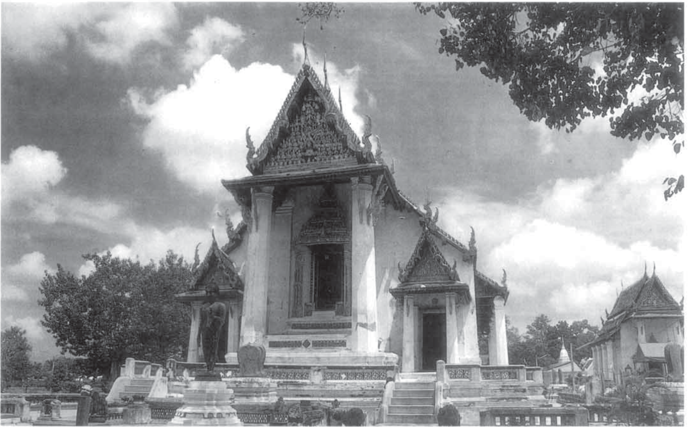
บริเวณวัดหน้าพระเมรุ ซึ่งมีงานสถาปัตยกรรมและศิลปกรรมล้ำค่ามากมาย ควรแก่การศึกษา