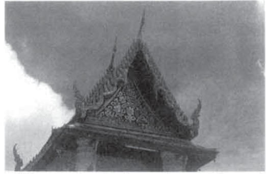
หน้าบันของพระอุโบสถ วัดหน้าพระเมรุที่งดงามมากที่สุดแห่งหนึ่งในอยุธยา