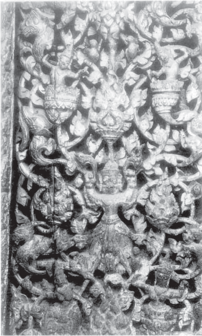
บานประตูของวิหารน้อย เป็นไม้สักแกะสลักปิดทอง

ตั้งแต่ก่อนข้ามสะพานเข้ามาสู่ภายในวัด รูปทรงของอุโบสถเป็นอาคารสี่เหลี่ยมผืนผ้า หันหน้าไปทางทิศใต้ กว้างประมาณ ๑๗.๔๐ เมตร ยาว ๔๑.๕๐ เมตร มีมุขยื่นออกมาด้านหน้าและหลัง โดยมีเสาแปดเหลี่ยมรองรับอยู่ หลังคาซ้อนลด ๒ ชั้น ประดับด้วยช่อฟ้าหางหงส์ ไบระกา ตามแบบอย่างสถาปัตยกรรมไทยเดิม ผนังด้านข้างของอาคาร เจาะช่องแสงเรียงเป็นแถว ๆ ซึ่งเป็นสิ่งที่นิยมกันมากในสมัยอยุธยา ทางด้านข้างมีชายคาปีกนกต่อยื่นออกมาจากผนังอาคารด้านนอก โดยมีเสานางเรียงเป็นแบบเสาแปดเหลี่ยมรองรับ มีบัวหัวเสาเป็นแบบบัวกลุ่ม เมื่อพิจารณาศิลปกรรมโดยรวมของพระอุโบสถนี้แล้ว จะเห็นได้ว่ายังปรากฏเค้าโครงเดิมของงานศิลปกรรมสมัยอยุธยาอยู่มาก แม้ว่าได้เคยผ่านการบูรณะซ่อมแซมในสมัยต้นกรุงรัตนโกสินทร์แล้วก็ตาม สำหรับการบูรณะใหญ่เมื่อครั้งพระยาไชยวิชิต (เผือก) นั้น ได้มีการจารึกไว้บนแผ่นหินชนวน ติดอยู่เสาใกล้อาสนสงฆ์ด้านหน้าติดกับประตูทางเข้าเอาไว้เป็นหลักฐาน