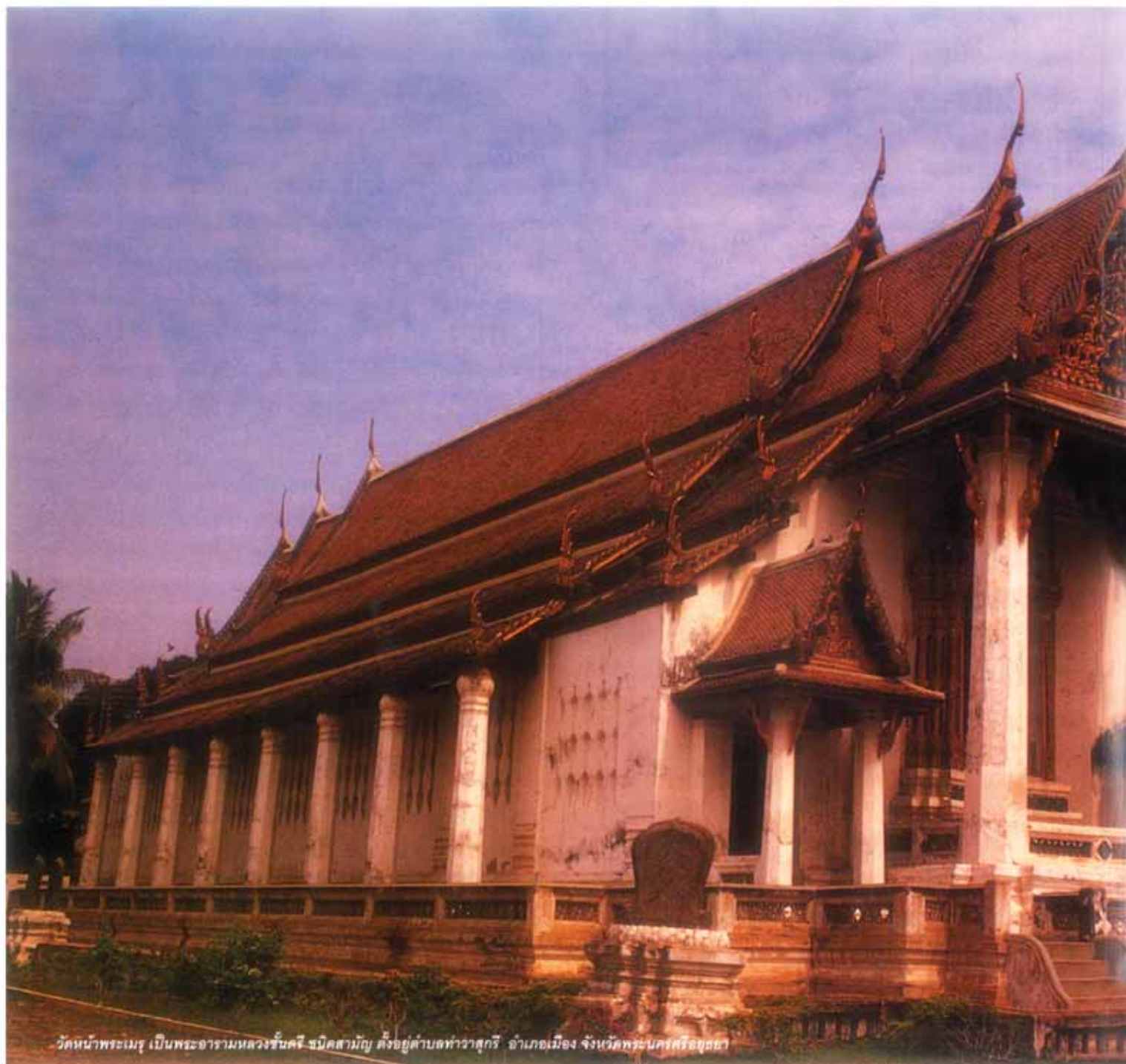
วัดหน้าพระเมรุ เป็นพระอารามหลวงชั้นตรี ชนิดสามัญ ตั้งอยู่ตำบลท่าราชวรดิฐ อำเภอเมือง จังหวัดพระนครศรีอยุธยา