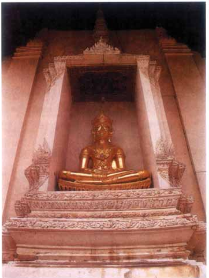
พระพุทธรูปปูนปั้นทรงเครื่อง ปางสมาธิ ศิลปะสมัยอยุธยา ซึ่งประดิษฐานในมุขด้าน หลังพระอุโบสถ

พระพุทธรูปนิกายวิจิตรวาทะโมลลิสร์สรเพชร บรมไตรโลกนาถ องค์พระประธานของ พระอุโบสถได้รับการยกย่องว่า เป็นพระพุทธรูปทรงเครื่องที่ใหญ่และงดงามที่สุด สมัยอยุธยา