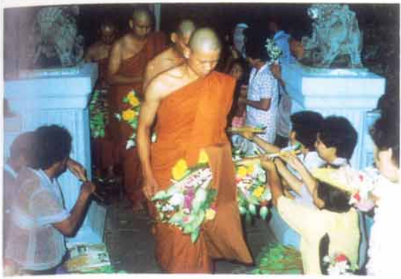
ภาพงานวันตักบาตรดอกไม้ วัดบวรนิเวศวิหาร