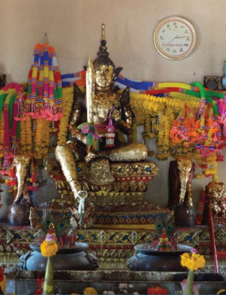
บน : เจ้าพ่อเทพารักษ์ที่ประดิษฐานภายในศาล ล่าง : ศาลเจ้าพ่อเทพารักษ์ (สร้างใหม่) ภายในบริเวณสระศักดิ์สิทธิ์ทั้งสี่