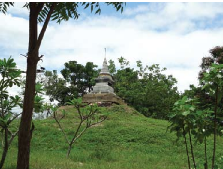
แนวคันดินใกล้กับสระเกษ ด้านล่างมีฐานอาคารก่อด้วยอิฐ แต่เจดีย์ด้านบนเป็นสิ่งก่อสร้างใหม่

“... ที่สระนั้นมันมีฐานต่าง ๆ อยู่อย่างไม่เป็นระเบียบ ตรงทางที่ขึ้นไปถึงสระคาก่อน สระขมนานอยู่ข้างเหนือ สระแก้ว อยู่ตะวันตกเกือบจะตรงกับสระคา สระเกษอยู่ข้างใต้แนวเดียวกับสระแก้ว แลเห็นปรากฏว่าเป็นสระที่ขุด มีเจดีย์ซึ่งว่ามีรูปหนึ่ง ไหลเฉียงเอาชื่อไม่ได้ ไปก่อสร้างฐานของเก่า ที่สระคา แห่งหนึ่ง สระขมนานแห่งหนึ่ง ที่สระแก้วเป็นศาลเจ้า ที่ซึ่งสำหรับ บวงสรวงก่อนตักน้ำสรง แต่ที่สระเกษนั้นมีคันดินสูงยาวไปมาก ที่บนนั้นมีรากก่อพื้นดินสูงจะเป็นเจดีย์กมณชบ ซึ่งถูกแก้แต่ไม่สำเร็จ สงสัยว่าที่เหล่านี้จะเป็นเทวสถานมีใช้วัด สระที่ขุดไว้เหล่านี้เป็นสระสำหรับพราหมณ์ลงชุบน้ำ ให้ผ้าเปียกเสีย ก่อนที่จะเข้าไปมัสการตามลัทธิศาสนาพราหมณ์ จึงจะได้เป็น สระที่ศักดิ์สิทธิ์ คันดินที่กล่าวนี้ว่ามียาวไปมาก น่าจะเป็นถนนถึงเมืองเก่า ที่นี้จะเป็นเทวสถานกวดพราหมณ์ที่ศักดิ์สิทธิ์ แห่งหนึ่งมาแต่สุพรรณเก่า จึงได้ใช้น้ำนี้เป็นน้ำอภิเษกสืบมา แต่โบราณ ก่อนพุทธศาสนาจะมาประดิษฐานในประเทศแถบนี้ มีเรื่องที่เกี่ยวข้องหลายเรื่อง เช่นพระเจ้าประทุมสุริวงษ์ เป็นเจ้าที่เกิดในดอกบัว ฤมาแต่ประเทศอินเดีย อันเป็นเจ้าแผ่นดินที่ ๑ ฤที่ ๒ ในวงศ์พรอินทร์ที่ครองกรุงอินทปัดพรนครหลวงเจ้าของพรนครวัด ก่อนพุทธศาสนากาลจะราชาภิเศกต้องให้มา ตักน้ำสี่สระนี้ไป แลในการพระราชพิธีอภิเศกต่าง ๆ ต้องใช้น้ำสี่สระนี้ พระเจ้าสินธพอมรินทร์พญาแกรกราชาภิเศก กรุงละโว้ ประมาณ ๑๔๐๐ ปีก็ว่าใช้น้ำสี่สระนี้ราชาภิเศก พระเจ้าอรุณมหาราชกรุงสุโขทัยจะทำการราชาภิเศกก็ต้องลงมาตีเมืองเหล่านี้ให้อยู่ในอำนาจ แล้วจึงตักน้ำไปราชาภิเศก จึงเป็นธรรมเนียมเจ้าแผ่นดินสยามทุกพระองค์ สรงมูรธาภิเศกแรกเสวยราชแลตลอดมาด้วยน้ำสี่สระนี้ มีเลขประจำเฝ้าสระรักษา