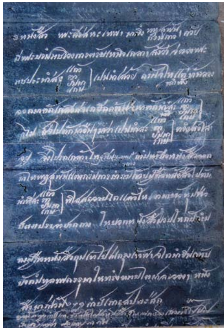
สมุดไทดำ จดหมายเหตุรัชกาลที่ ๔ จ.ศ.๑๒๑๗ เลขที่ ๖๔ เรื่อง หนังสือถึงพระยาสุพรรณบุรี ให้นายกองข้างถือหนังสือมาตองพระราชประสงค์น้ำ

สำหรับขั้นตอนในการปลุกกรรมตักน้ำจากสระศักดิ์สิทธิ์ทั้งสี่นั้น เอกสารจดหมายเหตุแต่เดิมไม่ได้ระบุขั้นตอนที่ชัดเจนเท่าใดนัก แต่มาพบในจดหมายเหตุครั้งรัชกาลที่ ๔ เมื่อ พ.ศ. ๒๔๐๗ ที่ให้รายละเอียดขั้นตอนเอาไว้ว่า เมื่อจะกระทำพิธีตักน้ำ ได้ให้หมอยอดสี่กรมช่าง และขุนพิไชยฤกษ์เฮอร์ เชิญท้องตราออกมายังพญาสุพันและกรมการ โดยให้จัดการปลุกศาลที่สระๆ ละศาล และจัดบายศรี ๔ สำหรับ ศิริระสุกร ๔ ศิริระ เครื่องกระยาบวช และให้จัดผ้าขาว เพื่อให้โหรนุ่งห่ม จากนั้นเมื่อถึงวันที่กำหนดก็ให้พญาสุพันและกรมการพร้อมภมอยอดสี่ และขุนพิไชยฤกษ์ออกไปที่สระเพื่อตั้งการบวงสรวงเมื่อโหรบอกฤกษ์แล้วให้ยิงปืนเป็นสัญญาณ จึงตักน้ำจากสระทั้งสี่ที่ใสสะอาดดี ใช้ผ้าขาวกรองอย่าให้มีผง นำน้ำใส่ในกระถางเอาผ้าขาวปิดปากกระถางแล้วเอาเชือกผูกประทับตราให้มั่นคงและมอบให้หมอยอดสี่กับขุนพิไชยฤกษ์ นำเข้าไปยังกรุงเทพโดยเร็ว