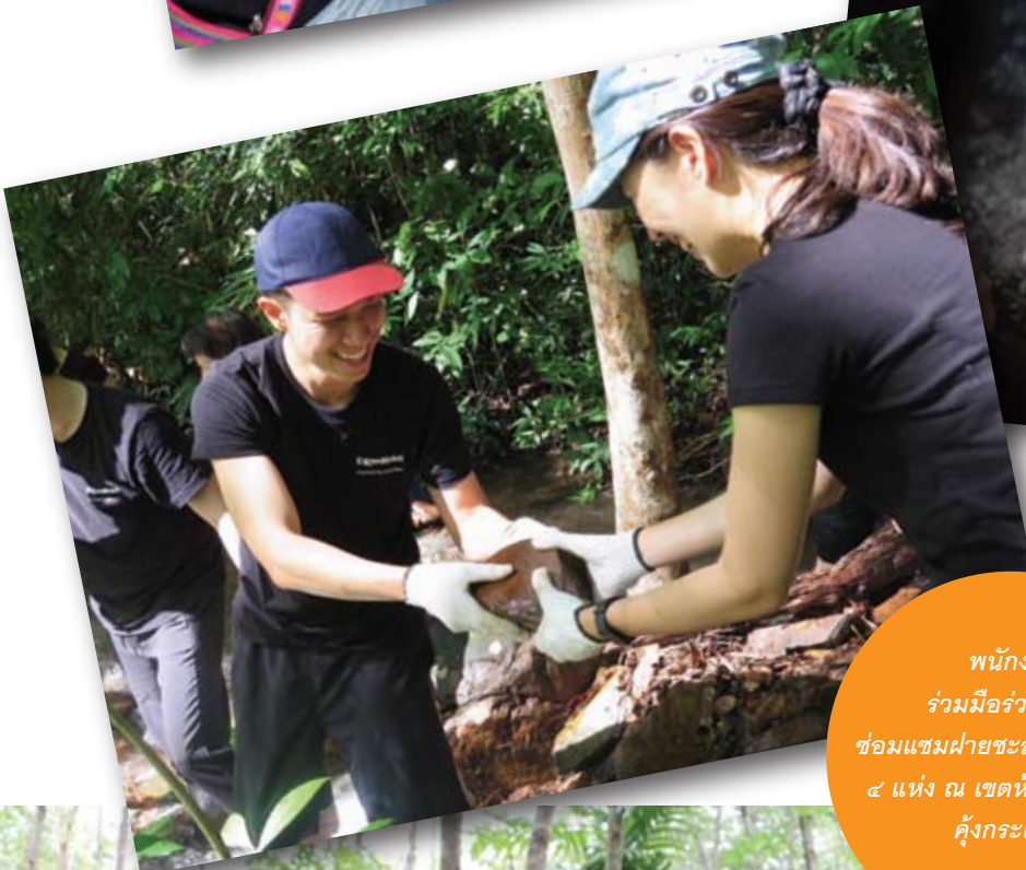
พนักงาน ร่วมมือร่วมใจกัน ซ่อมแซมฝายชะลอความชุ่มชื้น ๔ แห่ง ณ เขตห้ามล่าสัตว์ป่า คังกระเบน