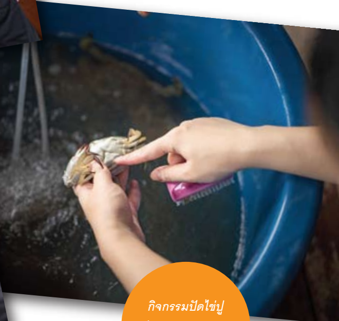
กิจกรรมปิดໄປ เพื่ออนุรักษ์พันธุ์ปูม้า อย่างยั่งยืน