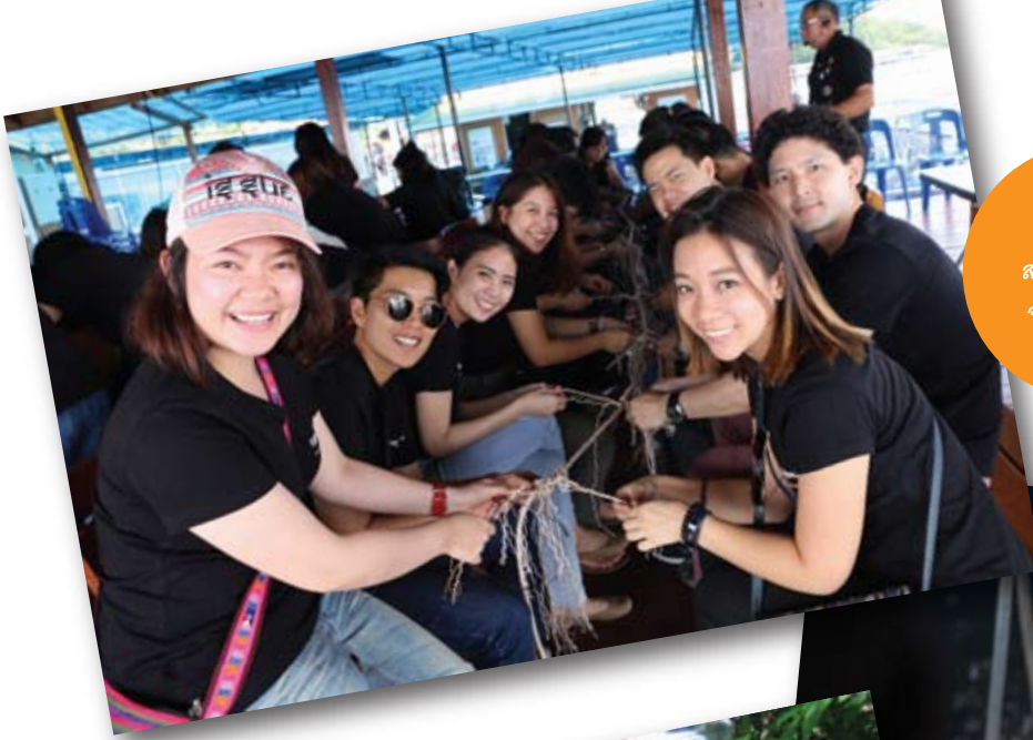
กิจกรรม สร้างบ้านปลา จากซั้งเชือก