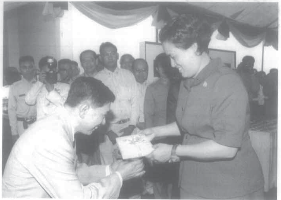
เลขาธิการมูลนิธิมูลเกล้าฯ ถวายหนังสือ

ต่อมา สำนักงานโครงการฯ ได้พิจารณาเห็นว่า ผู้จะเข้าอบรมควรมีความรู้พื้นฐานช่างทั่วไปก่อน โดยใช้ระยะเวลา ๓ เดือน หลักสูตรอบรมนั้นนอกจากจะให้ความรู้พื้นฐานทางช่างแล้ว ยังเป็นโอกาสที่จะทดสอบความมานะอดทน ความตั้งใจ และสนใจของแต่ละคน พระดาบสอาสาสมัคร ที่ทำหน้าที่ฝึกอบรมในแต่ละสาขาวิชา จะได้มีโอกาสพิจารณาคัดเลือกลูกศิษย์เข้ารับการฝึกอบรมใน