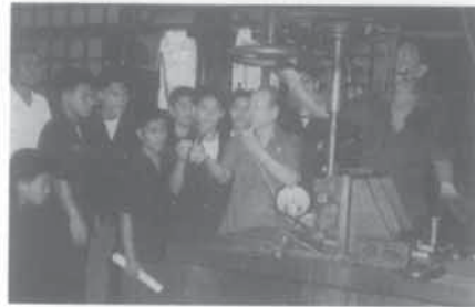
พระดาบสกำลังสั่งสอนศิษย์