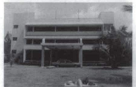
“อาศรมใหม่”