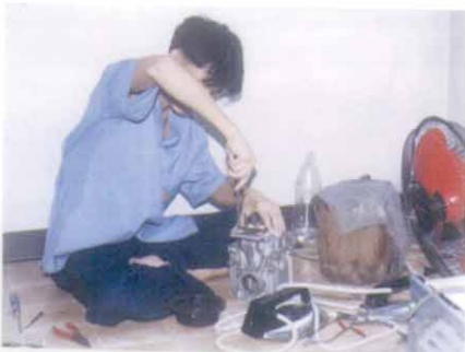
ศิษย์พระดาบสกำลังฝึกฝนวิชาชีพในสาขาต่าง ๆ