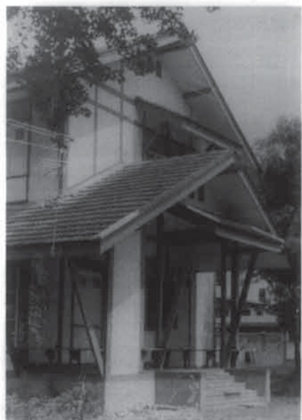
“อาศรมดั้งเดิม”

การทดลองได้เริ่มตั้งแต่เดือนสิงหาคม พ.ศ. ๒๕๑๔ โดยมีผู้เข้ารับการฝึกอบรม ๙ คน ในขั้นแรกได้กำหนดระยะเวลาการฝึกอบรมไว้ ๑ ปี ผู้ที่เข้ารับการฝึกอบรมจะสามารถซ่อมเครื่องรับวิทยุได้ แต่เมื่อปฏิบัติจริง ปรากฏว่าใช้เวลาเพียง ๙ เดือนเท่านั้น (นำอัตราเกี่ยวกับเลข ๙ คือ ปี ๑๙, ร.๙, ๙ คน, ๙ เดือน) ระหว่างการฝึกอบรมนอกจากวิชาช่างไฟฟ้าวิทยุทั้งภาคทฤษฎีและภาคปฏิบัติแล้ว ยังมีการอบรมศีลธรรมจรรยา ให้เคารพรักครูบาอาจารย์ ชาติ ศาสนา มี