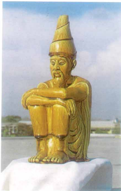
รูปปั้น “พระดาบส” ที่พระบาทสมเด็จพระเจ้าอยู่หัว ทรงพระกรุณาโปรดเกล้าฯ พระราชทานแก่โรงเรียนพระดาบส

ปางเมืองพระดาบสนิเทศน์ ผู้ทรงฤทธิลือไกลไปทั่วทุกแห่งหล้า สละโลกโกรทหลงทั้งหลายไปจนหมด มาทรงพรบ้ำาเข็ญเข็ญรภาวนา เอาใจใส่การสอนสั่งอย่างเคร่งครัด นอกจากจำวัดแล้วจะไม่ยอมเลิก ให้วิชาแก่ศิษย์ทั้งหลายด้วยใจเย็น...เอ๋ย ฯลฯ