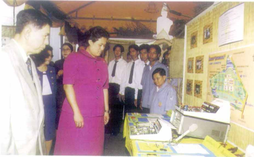
สมเด็จพระเทพรัตนราชสุดาฯ สยามบรมราชกุมารี เสด็จฯ ทอดพระเนตรนิทรรศการของโรงเรียนพระดาบส โดยมี พล.ต.ต.สุชาติ เผือกสกนธ์ เลขาธิการมูลนิธิพระดาบส เฝ้าฯ รับเสด็จ