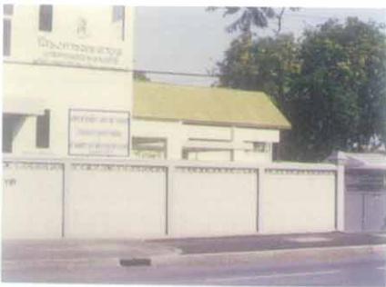
อาคารที่ทำการปัจจุบันของมูลนิธิพระดาบส