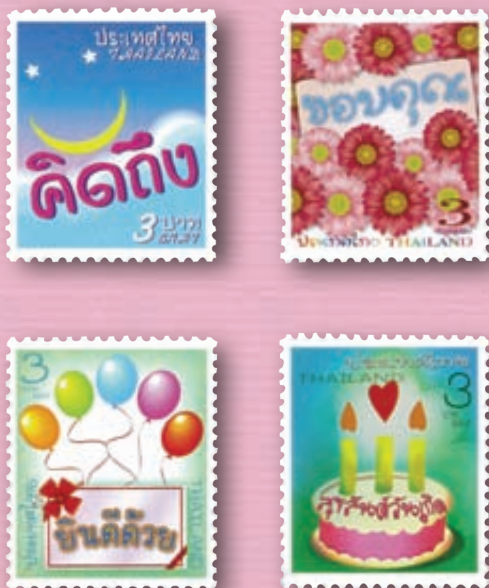
▶ แสตมป์ไทย ชุดข้อความ เพื่อบอกความในใจถึงกันและกัน - คิดถึง - ขอบคุณ - ยินดีด้วย - สุขสันต์วันเกิด