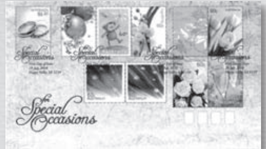
▶ ซองวันแรกจำหน่าย

๔. สมุดแสดมภ์พก (Booklet) เหมาะสำหรับผู้ที่เขียนจดหมายบ่อยๆ และต้องการใช้แสดมภ์ติดจดหมาย ไปรษณีย์ออสเตรเลียจึงจัดพิมพ์สมุดแสดมภ์พก บรรจุแสดมภ์ ๑๐ ดวงต่อเล่มเพื่อให้ประชาชนหาซื้อไปพกติดกระเป๋าสะดวก เมื่อ