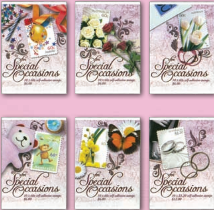
▶ ปกสมุดแสตมป์หก ๖ แบบ ให้ประชาชนเป็นผู้เลือกใช้ว่าต้องการภาพแบบไหน