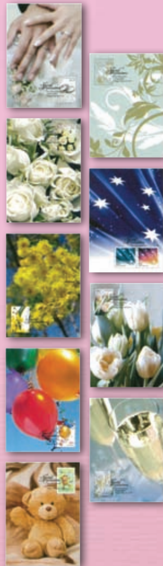
▶ บัตรภาพสมบุญ