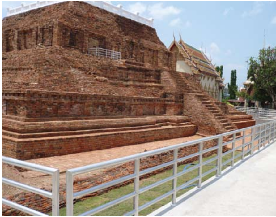
ฐานด้านล่างของพระประโทณเจดีย์ เป็นลักษณะของฐานเจดีย์สมัยทวารวดี

“...ถึงประโทณารามพราหมณ์เขาสร้าง เป็นพระปรารค์แต่บุราณนานนักหนา แต่ครั้งตวงพระธาตุพระศาสดา พราหมณ์ศรัทธาสร้างสรรดไว้มั่นคง บรรจพระทะนทานทองของวิเศษ พิน้อมเกศโมทนาอาณิงสงส์ จตุรูปเทียมนอกิวันทนด้วยบรรจง ถวายธงแพรวฟ้าแล้วลาจร...”