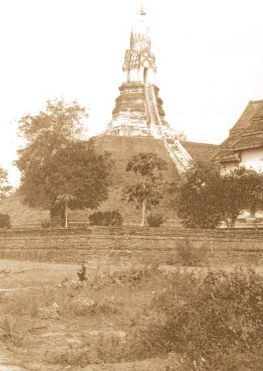
ภาพถ่ายเก่าของพระประโทณเจดีย์ ก่อนการบูรณะ