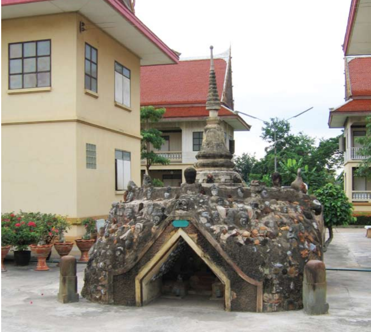
อนุสาวรีย์หลวงพ่อชุ่ม ภายในเขตวัดพระประโทน