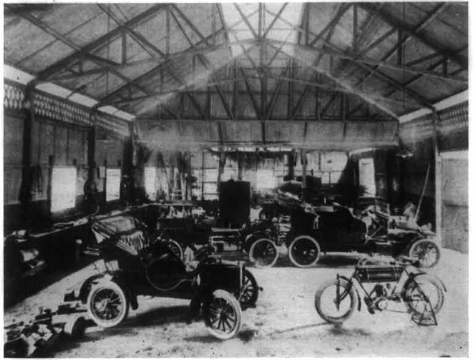
อู่ซ่อมรถยนต์ของบริษัททางกอดด็อกใน พ.ศ. ๒๔๕๑

ถามที่คุก เขาบอกว่าไม่มีรถยนต์อยู่ในนั้น หม่อมฉันเรียกพนักงานในคุกที่เป็นคนเก่า ทันอยู่กับกรมหลวงราชบุรี มาถาม เขา บอกว่าเมื่อกรมหลวงราชบุรี รับรถมาตรวจ ดู เห็นชำรุดบอบสลายมาก จะแก้ไขให้ คืบคืบไม่ได้ ก็ทอดทิ้งรถนั้นในโรงงาน ที่หลังมาคนนั้นคนนี้จะปรารถนาเครื่อง เหล็ก ก็ถอดเอาไปใช้ทำการอื่น ๆ ที่ละชั้น สองชั้น จนรถเหลือแต่ซากแล้วก็สูญไป เป็นสิ้นเรื่องรถเจ้าพระยาสุรศักดิ์แต่เพียง นั้น”