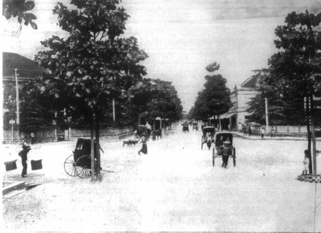
สภาพของถนนเจริญกรุงตอนใต้ที่พระยาสุรเมือ ๕๐ กว่าปีมาแล้ว

สำหรับสาเหตุที่กรมหลวงราชบุรี จะนำรถยนต์มาใช้ในเมืองไทยนั้น หม่อมราชวงศ์สีกักศักดิ์ทรงค์ ชมด้วย ได้เล่าไว้ใน "โชคชะตาชีวิตพระเจ้า พอล" ว่า ใน พ.ศ. ๒๔๔๑ กรมหลวง ราชบุรีฯ ได้ทรงประชวร และได้เสด็จ ไปรักษาพระองค์ ณ ทวีปยุโรป ใน การเสด็จครั้งนี้ เมื่อไปถึงปารีสได้ ทรงสั่งให้บริษัทผลิตรถยนต์ของชาติ เยอรมันในกรุงปารีส ทำรถเก๋งหนึ่งคัน ยี่ห้อเมอเซเดสเดมเลอร์ ซึ่งนับเป็น รถยนต์หนึ่งในเวลานั้น ครั้นเมื่อพระองค์ เสด็จกลับก็ทรงนำรถยนต์คันนี้มาด้วย และเสด็จในกรมได้นำขบวนทูตเสด็จถวาย พระบาทสมเด็จพระจุลจอมเกล้าฯ พระ ชนกนาถในปีนั้น เป็นอันว่า "รถยนต์ พระที่นั่ง" ได้มีขึ้นเป็นครั้งแรกเป็น ประวัติศาสตร์ และเสด็จในกรมหลวง